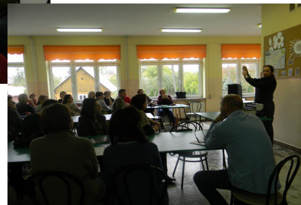
Substancje psychoaktywne, wrzesień 2017 r.