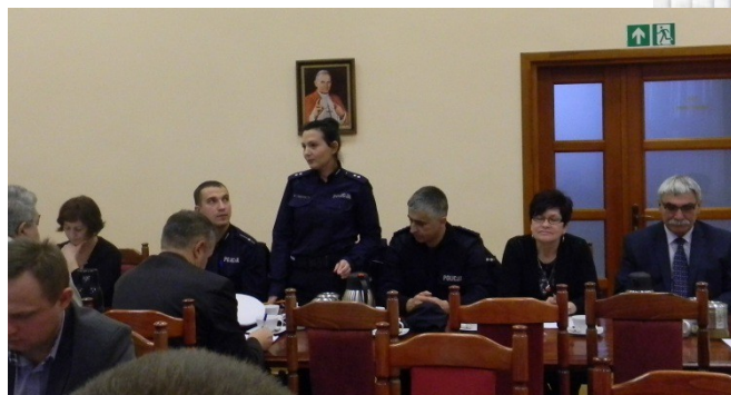
Krajowa Mapa Zagrożeń Bezpieczeństwa, listopad 2017 r.