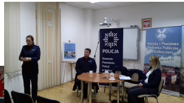
Przemoc w rodzinie, październik 2017 r.