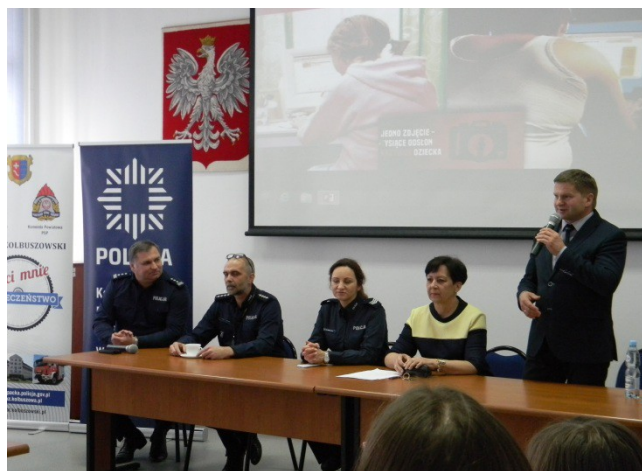
O cyberprzemocy, maj 2017 r.